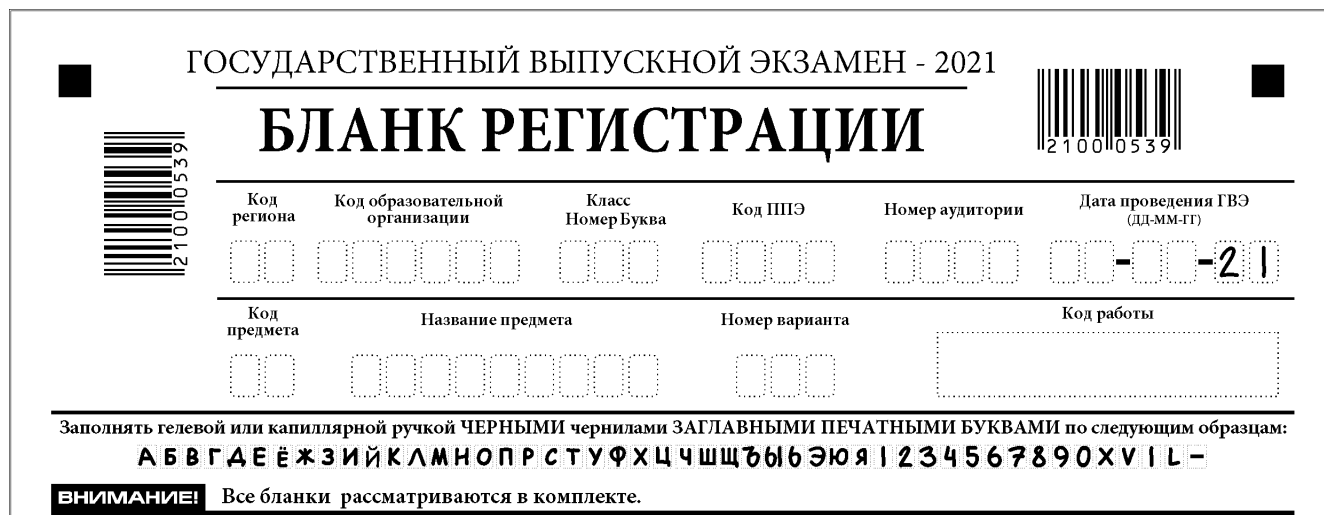
Рис. 2. Верхняя часть бланка регистрации

По указанию ответственного организатора в аудитории участники ГВЭ приступают к заполнению верхней части бланка регистрации (рис. 2). Участником ГВЭ заполняются все поля верхней части бланка регистрации (таблица 1). Поле «Код работы» заполняется автоматически.