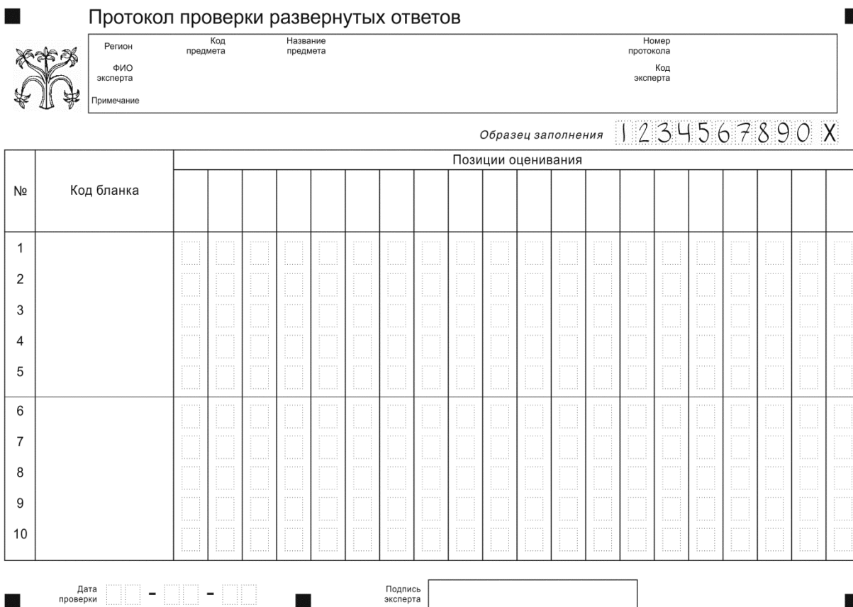
Рис. 1. Протокол проверки развернутых ответов

Верхняя часть протокола заполняется автоматизированно (рис. 2). В левой части протокола автоматизированно заполнены коды бланков работ, которые были назначены эксперту.